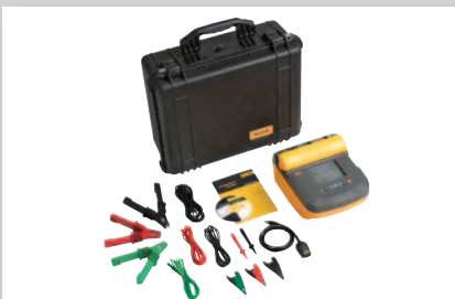
Fluke 1555C -eristysvastusmittaripaketti