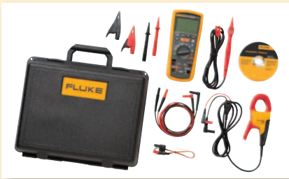
Fluke 1587 FC ET Sähköjärjestelmien tehokas vianhakupaketti