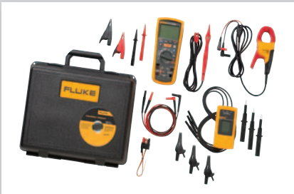
MDT: Moottorien ja moottorikäyttöjen vianhaku