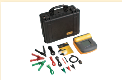
Fluke 1555 -eristysvastusmittaripaketti